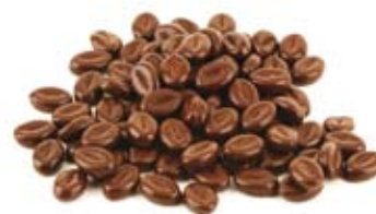
Grains de café chocolat noir 3067