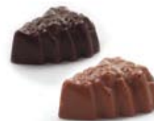
Feuille de houx-caraques 4gr C004