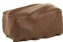
Nougat enrobé de chocolat noir 3031