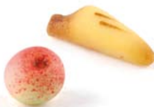
Fruits en pâte d'amande 28g 3038