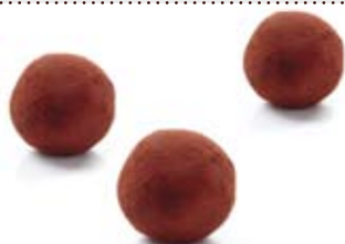
Petits pommes de terre en pâte d'amande 3036