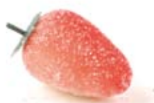
Fraise pâte d'amande 349