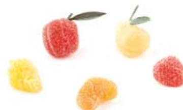
Pâte de fruits 3021