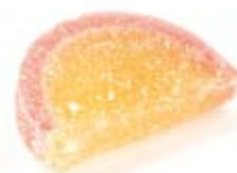
Tranches agar 3020