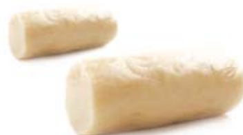
Petites buches en pâte d'amandes 250 en 500g 4100/4101